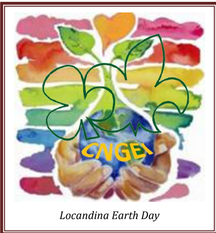
Locandina Earth Day

Associativo e, ad aprile, il branco partecipa, insieme all'Associazione Estuario all'iniziativa "aspettando il 25 aprile", workshop per bambini sui temi della liberazione in cui i lupetti e le lupette hanno potuto giocare e interagire con gli operatori e i bambini e le bambine sorde con cui hanno anche svolto una piccola rappresentazione teatrale. Oltre alle normali attività, ad aprile la Sezione tutta aderisce all'Earth Day pulendo da foglie e rami secchi un'area a Coreglia Antelminelli.