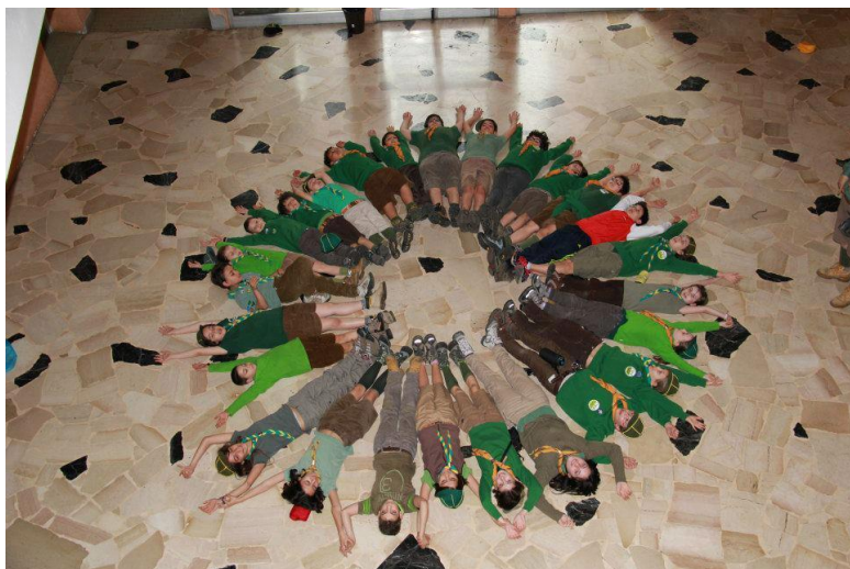
Gemellaggio col Branco di La Spezia

2009/2010: facciamo il nostro primo campo invernale di Gruppo a Pian di Cerreto e,