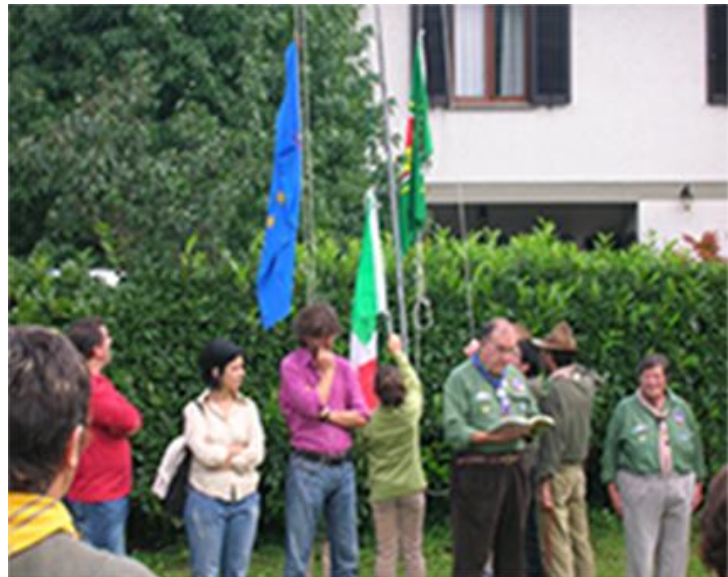
Cerimonia di costituzione del Gruppo Autonomo

2007/2008: il Gruppo si ingrandisce: oltre al Branco nasce il Reparto, formato da 8 Esploratori ed Esploratrici e aumentano anche gli adulti iscritti che diventano 12. All'inizio del 2008, dalla baracca, ci trasferiamo nel capannone della parrocchia, dietro la Chiesa di Chifenti, locale che dividiamo per ricavare due stanze: una per il