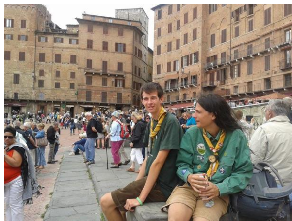
Agosto 2014: i rover arrivano a Siena!