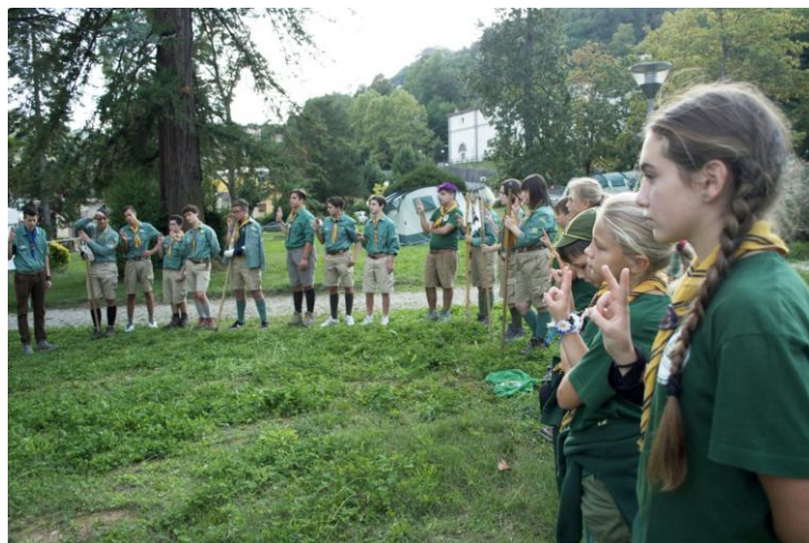
2016/17: Apertura dell'anno scout a Bagni di Lucca

2016/2017: è l'anno dedicato alla celebrazione dei nostri primi 10 anni di attività. Abbiamo iniziato l'anno con due giornate a Bagni di Lucca dove abbiamo organizzato una serie di giochi a basi in occasione del "Paese dei Balocchi", siamo stati con il branco a Firenze per la celebrazione del centenario del lupettismo, siamo andati, come adulti, alle "Occasioni di Primavera" a Calambrone e abbiamo organizzato un bellissimo San Giorgio di Sezione a Pian di Cerreto il 22, 23, 24, 25 aprile.